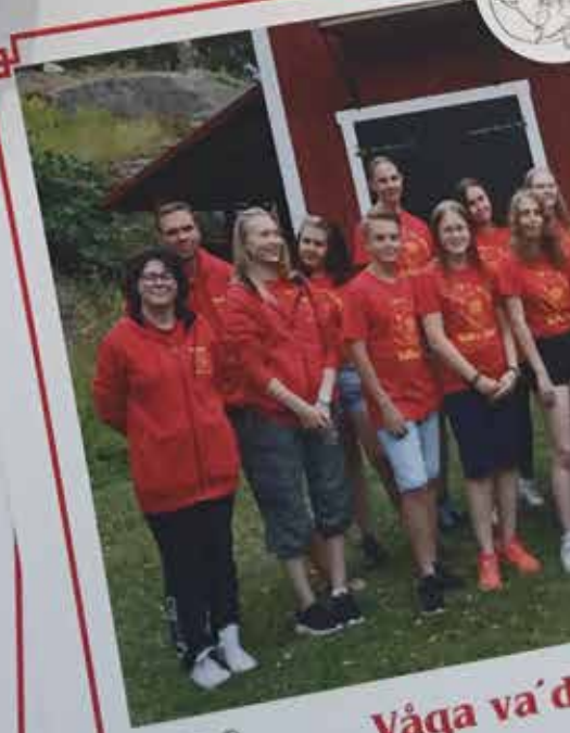
Våga va' dig själv!!!-lägret 6 augusti - 12 augusti Vettra