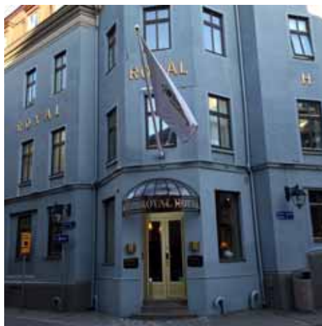
Hotel Royal Göteborg