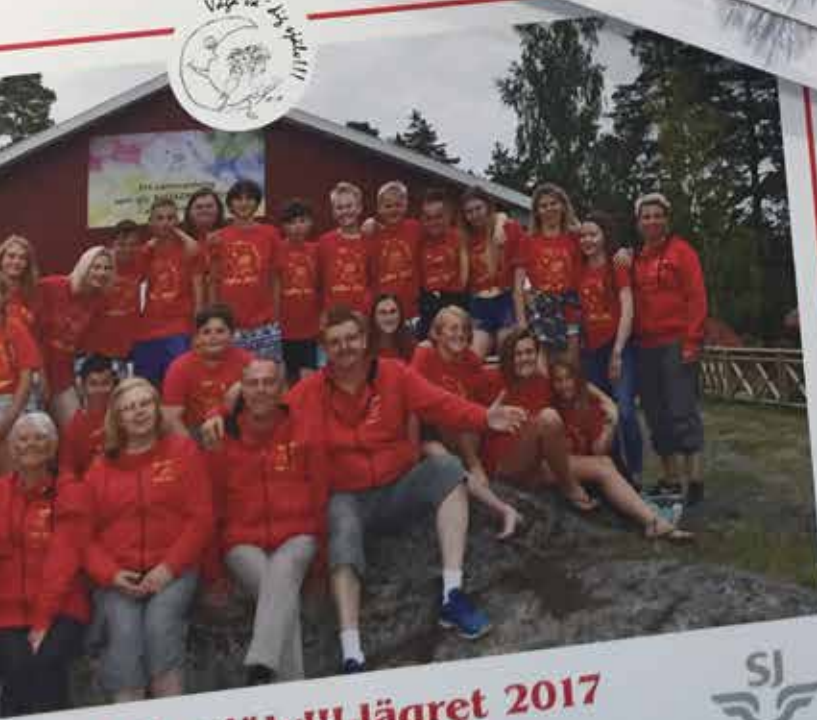
Våga va' dig själv!!!-lägret 2017 24 juli - 30 juli Vettra