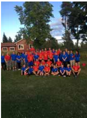
IFK Motala Bandy

ICA MAXI Visby, ICA MAXI Partille, ICA MAXI Motala, ICA Kvantum Bålsta