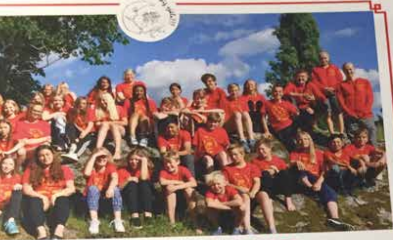
Våga va' dig själv!!!-lägret 2017 16 juni - 22 juni Vettra