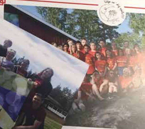
Våga va' dig själv!!!-lägret 17 juli - 23 juli Vettra