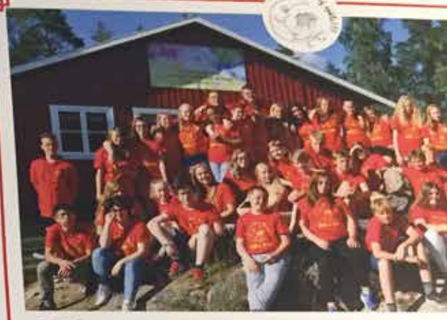
Våga va' dig själv!!!-lägret 27 juni - 3 juli Vettra