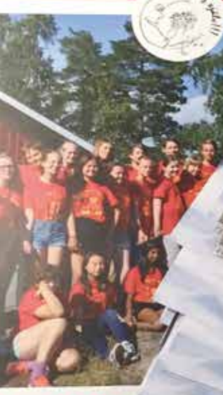
Våga va' dig själv!!!-lägret 7 juli - 13 juli Vettra